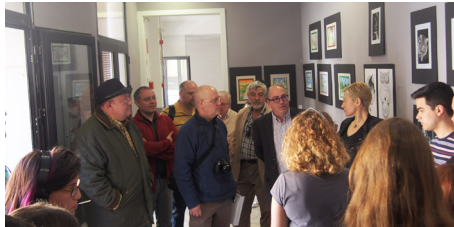
Inauguração da exposição.

na Faculdade de Arquitetura. Os alunos tiveram ainda a oportunidade de visitar a Catedral de Sevilha e o Real Alcazar, o Parque Maria Luísa e as monumentais Praça da América e Praça de Espanha. JD